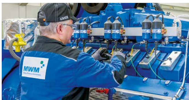
Control de calidad antes de la entrega

Para el overhaul se utilizan exclusivamente shortblocks y culatas originales X-Change de MWM, piezas nuevas y de repuesto de MWM, así como componentes revisados por el fabricante. También se renueva para ello todo el cableado del motor.