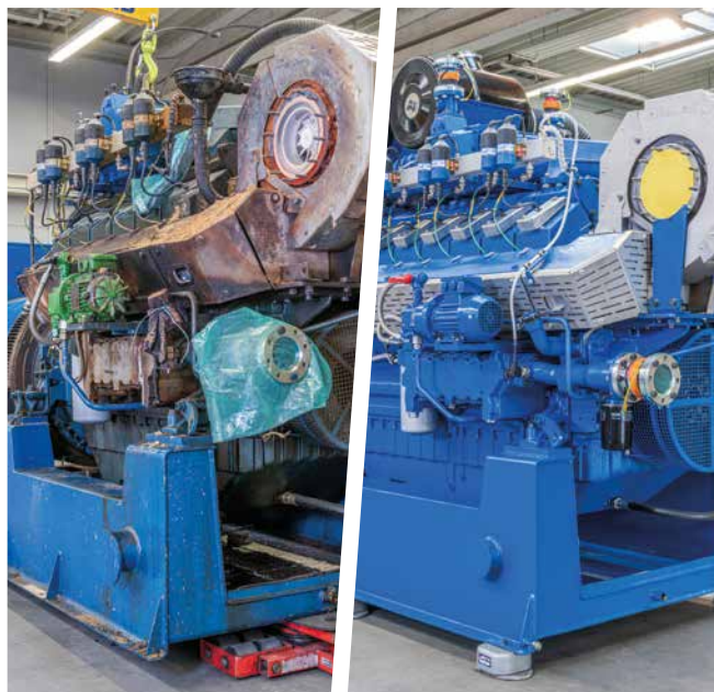
Después de 3-4 días, la unidad de intercambio X-Change de MWM (con las últimas actualizaciones técnicas y recién pintada) estará lista para su uso