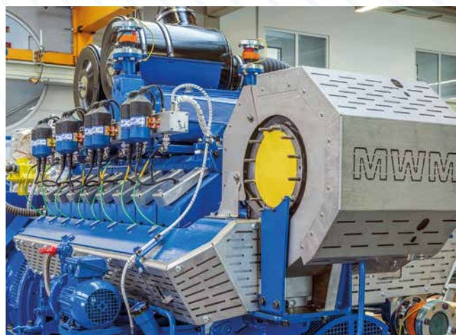
Unidad de intercambio X-Change reacondicionada