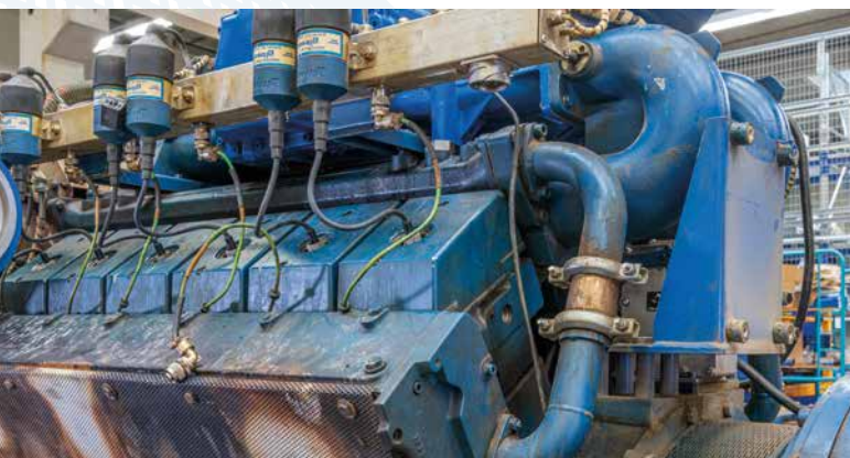
Antes del mantenimiento

MWM ofrece unidades de intercambio X-Change reacondicionadas para los motores TCG 2016 y TCG 2020 según las especificaciones actuales del fabricante y a precios fijos muy atractivos.